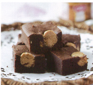
ビスコフボール ブラウニー with ロータスビスケットスプレッド