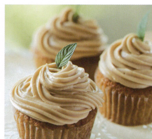
キャロット・カップケーキ with ロータスビスケットスプレッド

ロータスビスコフ・ ビスケットスプレッドを 使った簡単で美味しい デザートレシピを ご紹介します。