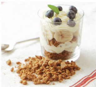
季節のフルーツのマスカルポーネクリーム添え with ロータスビスコフ