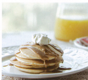
パンケーキ with ロータスビスケットスプレッドソース