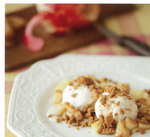
バニラアイスの焼きリンゴ with ロータスビスコフ